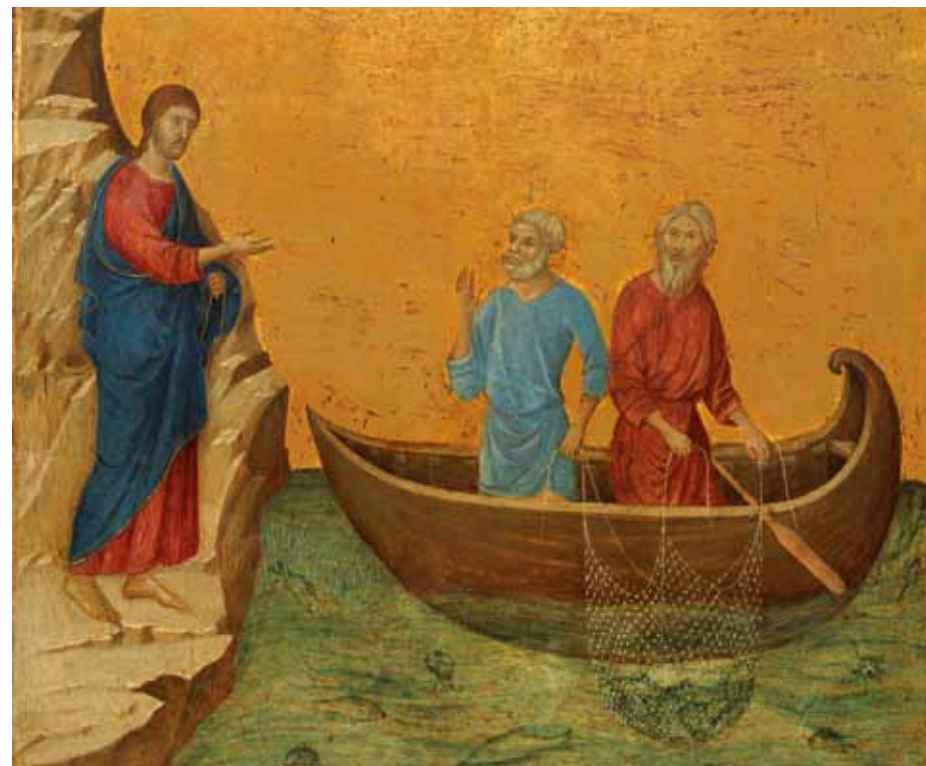
Afbeelding: De roeping van Petrus en Andreas

Wij bidden U om roepingen tot het priesterschap, het diaconaat en het religieuze leven; dat vele mannen en vrouwen uw roepstem mogen horen en in geloof op deze stem mogen antwoorden, tot heil van de wereld en tot lof en eer van uw Naam.