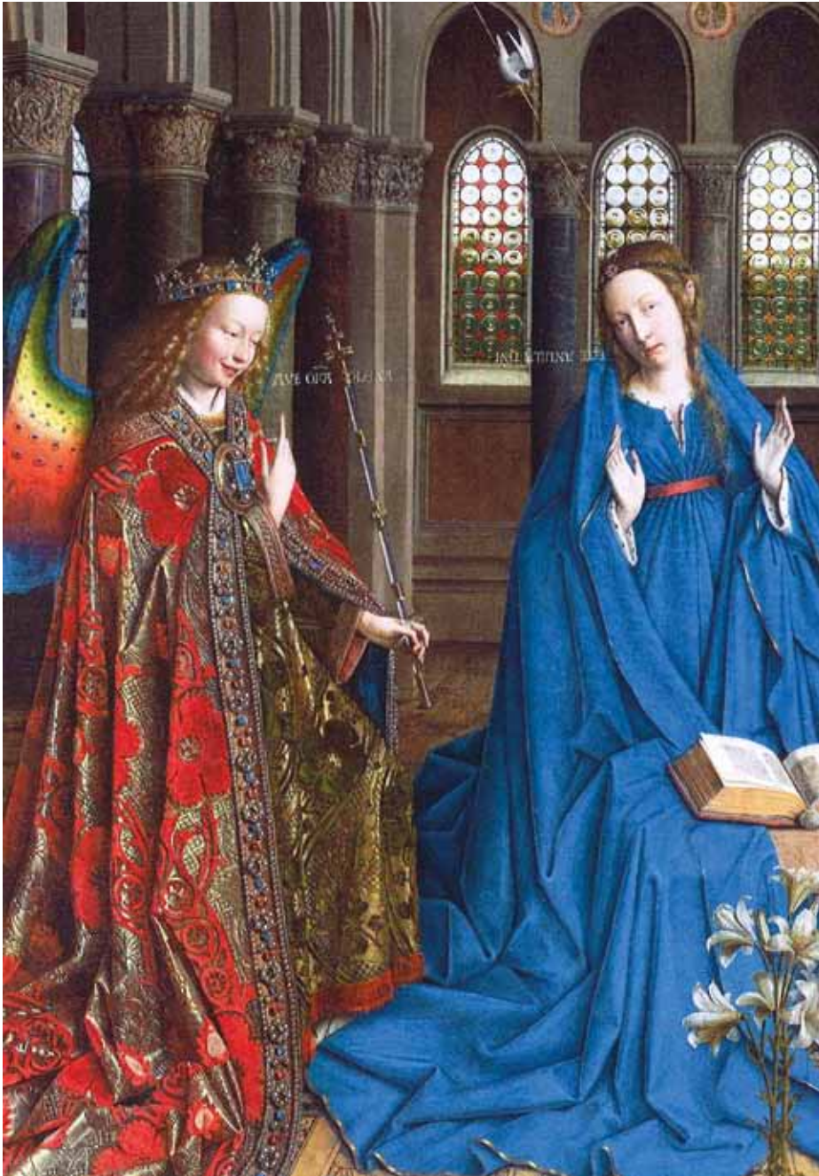
Afbeelding: Jan van Eyck, Annunciatie (detail)