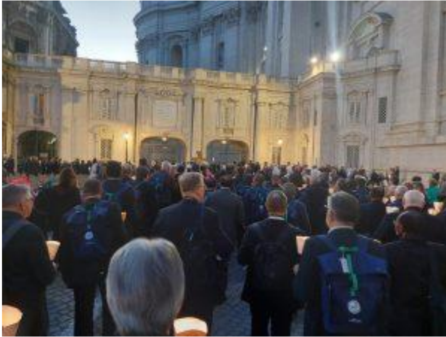
Piazza dei Protomartiri : oecumenische gebedswake