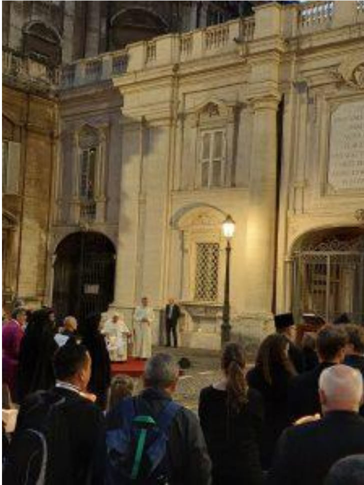
Paus Franciscus bij oecumenische gebedswake

Tijdens de oecumenische gebedswake (zie foto) verklaarde paus Franciscus: