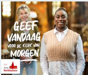
Actie Kerkbalans 2023: 14 - 28 januari

Ook dit jaar promoten we Actie Kerkbalans op social media. Onderstaande advertenties op Facebook, Twitter en Instagram zijn in de actieperiode te zien voor een christelijke/kerkelijke groep mensen. We roepen hen zo op te geven voor hun plaatselijke kerk. U kunt de posts uiteraard delen via uw eigen social mediakanalen, én die van uw kerk. Van harte aanbevolen!