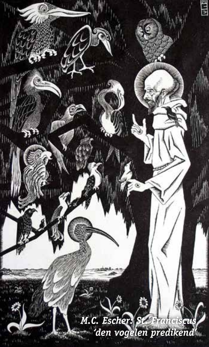
M.C. Escher: St. Franciscus 'den vogelen predikend'